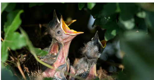
Nest jonge merels.

Hang het in de tuin of op het balkon en bekijk welke vogels het materiaal er uit komen trekken.