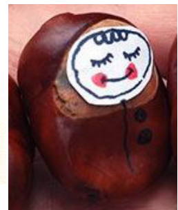
Voorbeeld babytjes van larikskegeltje en kastanje