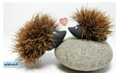
Egel van bolster van een kastanje.

Egels wonen in bossen, maar ook in de stad, in parken en tuinen als er voldoende groen en schuilplaatsen te vinden zijn. Overdag verschuilen egels zich onder struiken, takkenbossen of in verlaten konijnenholen. 's Avonds gaan ze op pad, op zoek naar kevers, rupsen, regenwormen, oorwurmen, slakken, eieren of bessen. Slakken eten ze met huisje en al op. Egels kunnen heel goed ruiken. Ze hebben zelfs een zesde zintuig: het Orgaan van Jacobson, dat tussen het gehemelte en de neusholte ligt. Het helpt de egel de geur van prooien te herkennen. Als de egel een prooi ruikt krijgt hij schuimend speeksel in zijn bek. De geur gaat in het speeksel dat hij met zijn tong naar het Orgaan van Jacobson brengt, waarna hij weet welk prooi in de buurt is. Bij gevaar rollen egels zich op als een bal en zetten ze hun stekels overeind. In de winter, ongeveer van november tot april, gaan egels in winterslaap. Ze maken een winternest op een beschutte plek in de grond, in een schuurtje, onder een takkenberg of onder een grote hoop bladeren. En daar slapen ze dan de hele winter.