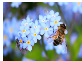
Een 'bezige' bij.